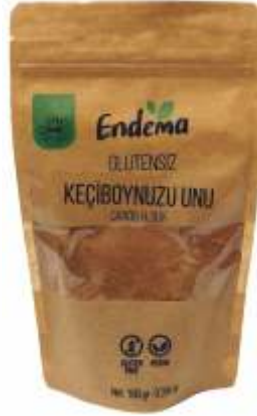
Keçiboynuzu Unu - 90 gr