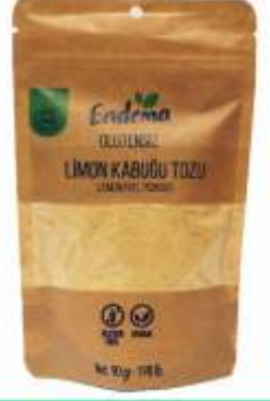
Limon Kabuğu Tozu - 90 gr