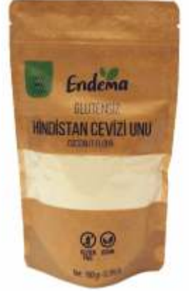
Hindistan Cevizi Unu - 180 gr