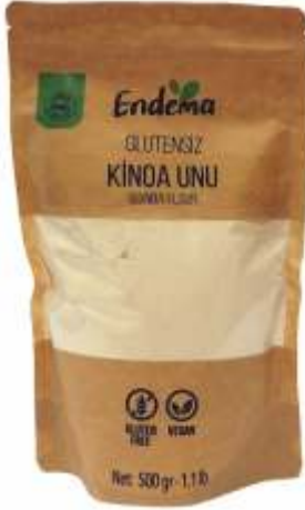
Kinoa Unu - 500 gr