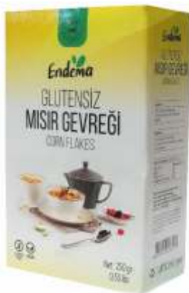
Mısır Gevreği - 250 gr