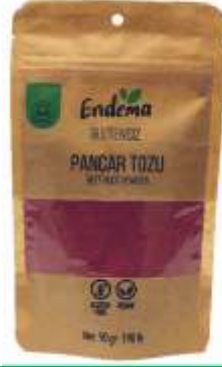
Pancar Tozu - 90 gr