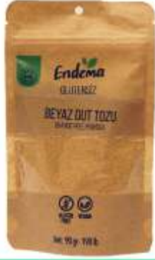
Beyaz Dut Tozu - 90 gr