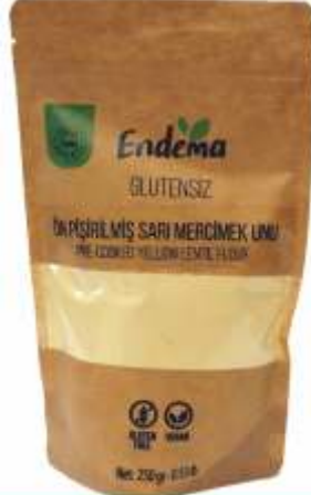
Ön Pişirilmiş Sarı Mercimek Unu - 250 gr