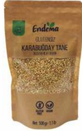
Karabuğday Tane - 500 gr