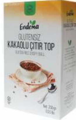
Kakaolu Çıtır Top - 250 gr