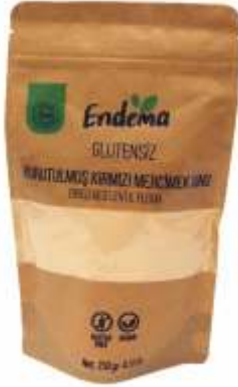
Kurutulmuş Kırmızı Mercimek Unu - 250 gr