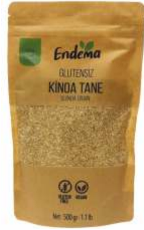
Kinoa Tane - 500 gr