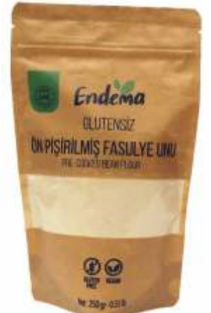
Ön Pişirilmiş Fasulye Unu - 250 gr