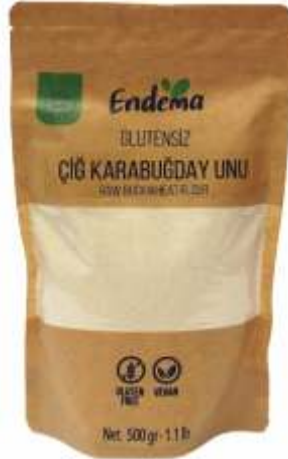
Çiğ Karabuğday Unu - 500 gr