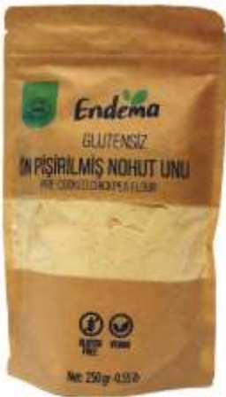
Ön Pişirilmiş Nohut Unu - 250 gr