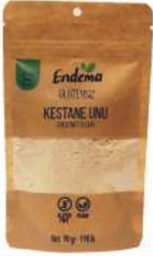
Kestane Unu - 90 gr