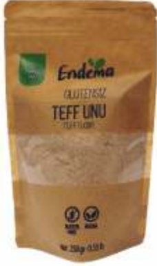
Teff Unu - 250 gr