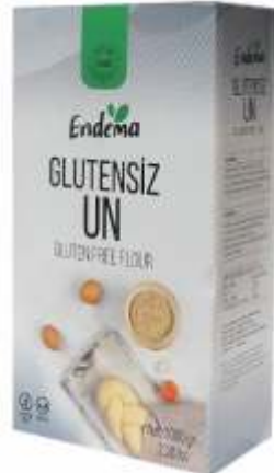
Glütensiz Un - 1000 gr